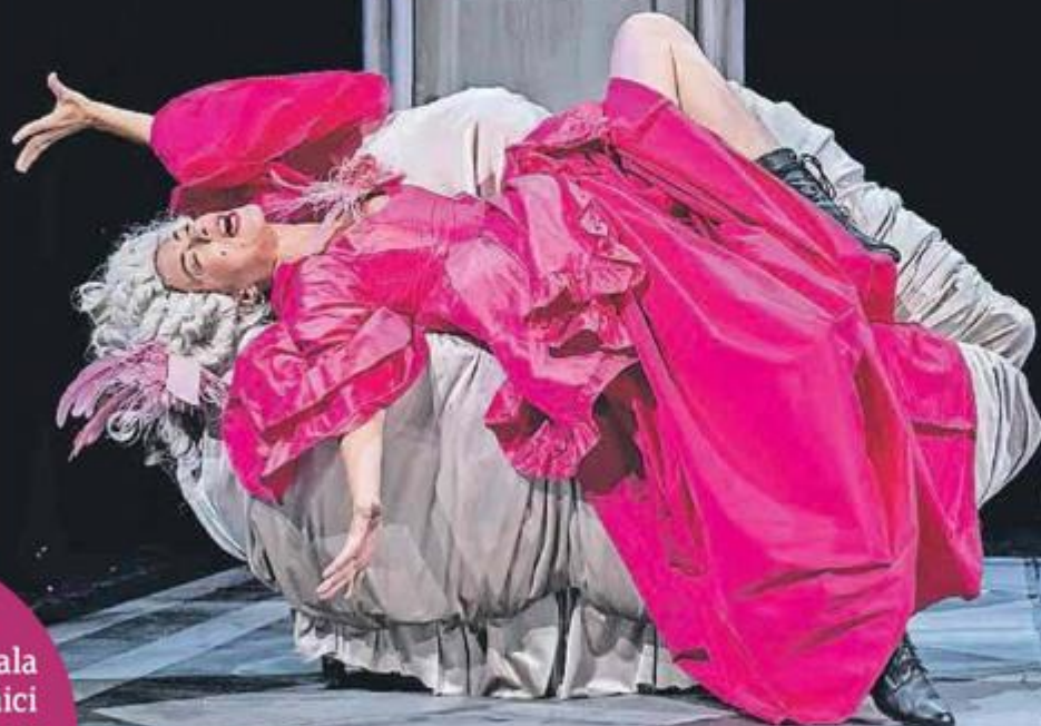
"Candide" Kazališta Marina Držića raden je kao raskošna predstava

Čitatelji mogu glasati putem portala jutarnji.hr na stranici Zlatni Studio ili putem kupona koji se objavljuju petkom u TV prilogu Studio