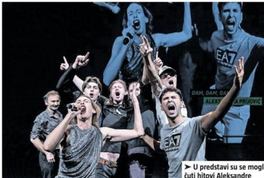
► U predstavi su se mogli čuti hitovi Aleksandre Prijovića i Mile Kitića

Iako je njegova tržišna vrijednost pala zbog depresije, Ergić tvrdi da mu je bolest pomogla. Nakon izlaska iz bolnice lakše se nosio na treningu, a i izvan njega. Kasnije je vratio tržišnu vrijednost.