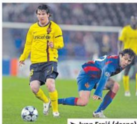
► Ivan Ergić (desno) i Messi 2008. godine