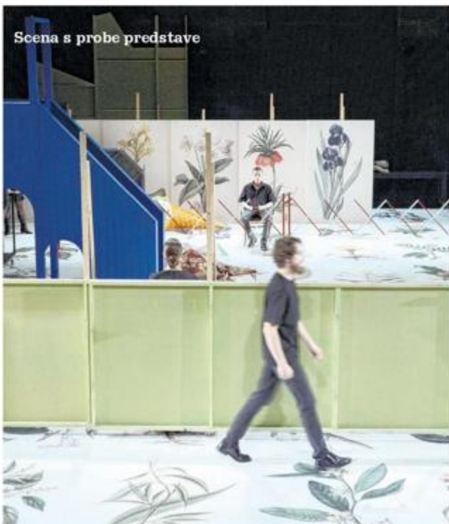
Scena s probe predstave