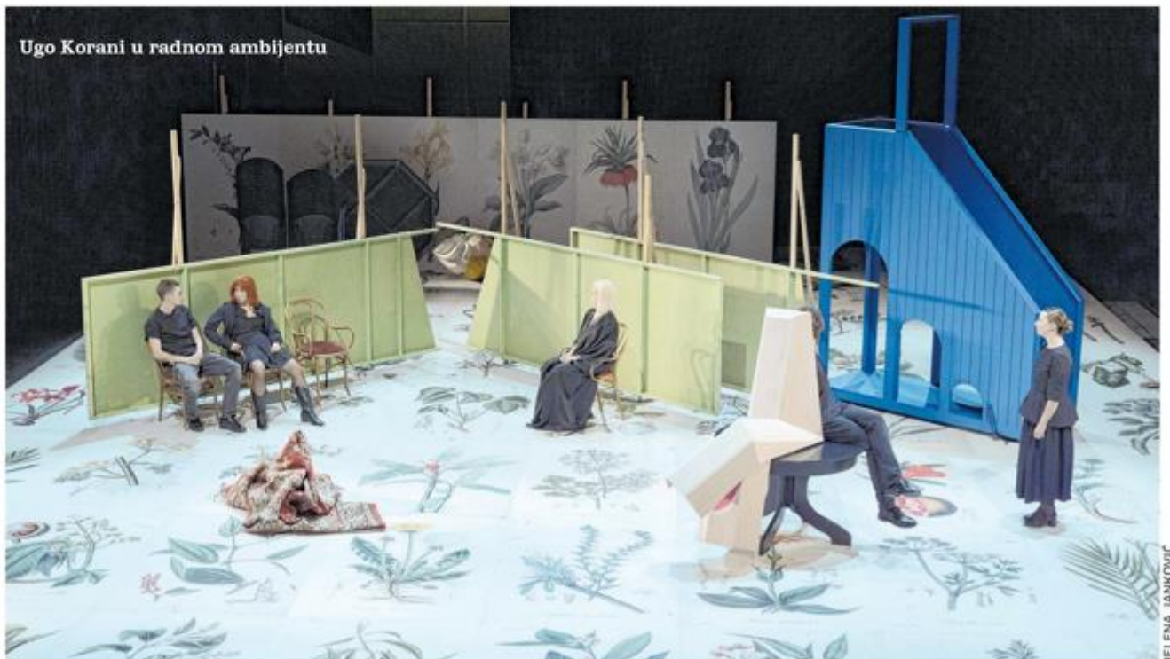
Ugo Korani u radnom ambijentu